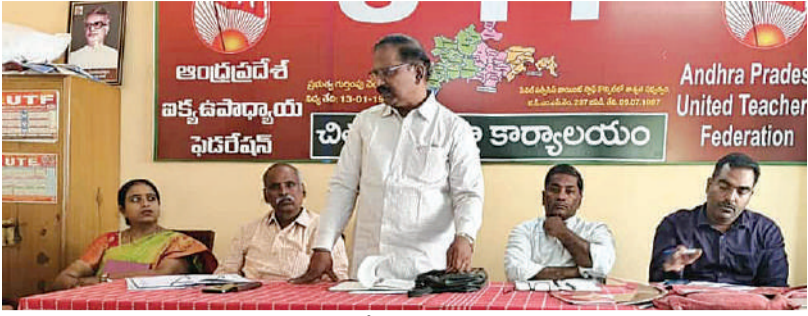
చిత్తూరు, అక్టోబర్ 27 ప్రభాతవార్త: ఉద్యోగ, ఉపాధ్యాయుల ఆర్థిక బకాయిలు సత్వరం విడుదల చేయాలని యుటిఎఫ్ జిల్లా కార్యదర్శి వర్గ సమావేశం ప్రభుత్వంను డిమాండ్ చేసింది. జిల్లా యుటిఎఫ్ కార్యాలయంలో ఆదివారం జిల్లా యుటిఎఫ్ కార్యదర్శి వర్గ సమావేశం జరిగింది. ఈ సమావేశంలో రాష్ట్ర యుటిఎఫ్ గౌరవ అధ్యక్షుడు